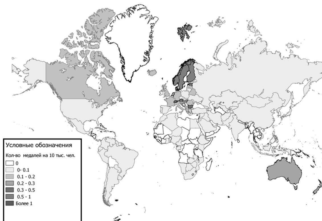
Рис. 3. Количество Олимпийских медалей на 10 тыс. чел.

Это говорит о том, что данный показатель не может являться основой для определения стран-лидеров Международного олимпийского движения, потому что все государства имеют разную численность населения.