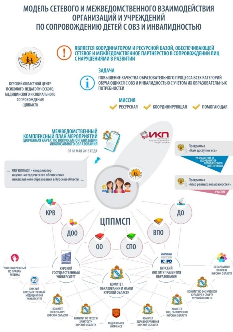
Рис. 5. Сетевое взаимодействие Курского областного центра психолого-педагогического, медицинского и социального сопровождения в организации инклюзивного образования Курской области

В основу модели сетевого сотрудничества организаций и учреждений по сопровождению детей с ОВЗ и инвалидностью заложена сложившаяся в Курской области иерархичная система межведомственного взаимодействия субъектно-автономных структур федерального и регионального уровня, целевой установкой которой является оказание психолого-педагогической, медицинской, социальной помощи детям, имеющим трудности в обучении, воспитании, развитии, адаптации, их родителям (законным представителям), специалистам, работающим с детьми данной категории.