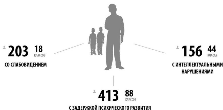
Рис. 2. Обучение детей с ОВЗ и инвалидностью в отдельных «специальных» классах

Также дефектологические традиции сохраняют отдельные «специальные» классы, которые функционируют в областном центре и ряде других городов. В них обучаются дети с ЗПР, с интеллектуальными нарушениями, с нарушением зрения.