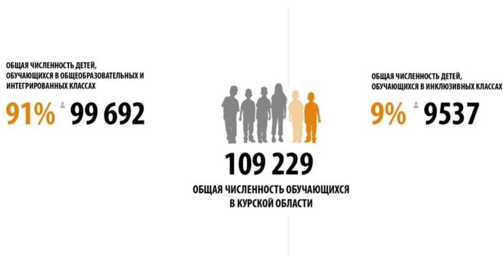
Рис. 3. Общие сведения об обучающихся в общеобразовательных, интегрированных и инклюзивных классах Курской области

Общие сведения о детях школьного возраста, охваченных разными образовательными форматами, представлены на рисунке 3.